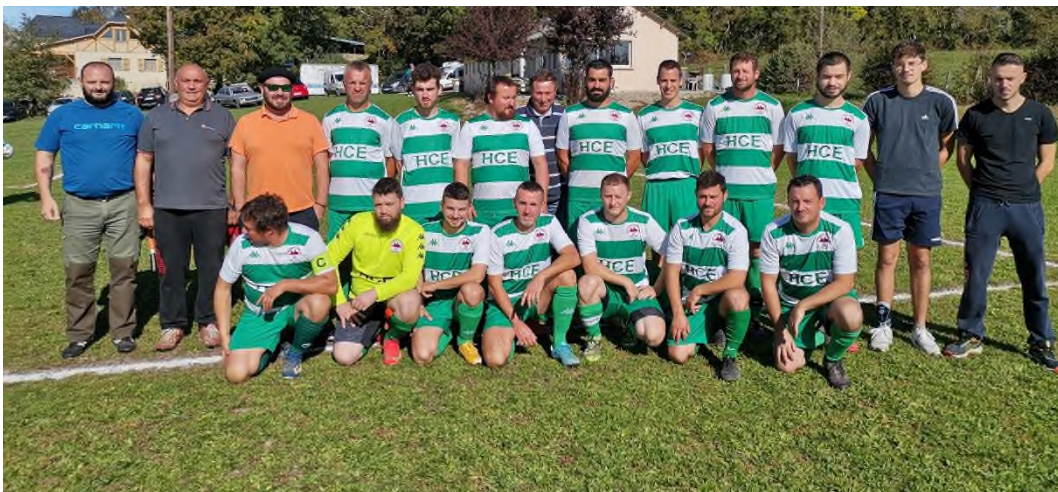
L'effectif 2021-2022 (et non ce n'est pas le Président qui tourne la tête...)

Après la saison dernière tronquée, pour l'instant la saison se déroule normalement même si les ambitions de début de saison ont été mises à mal...