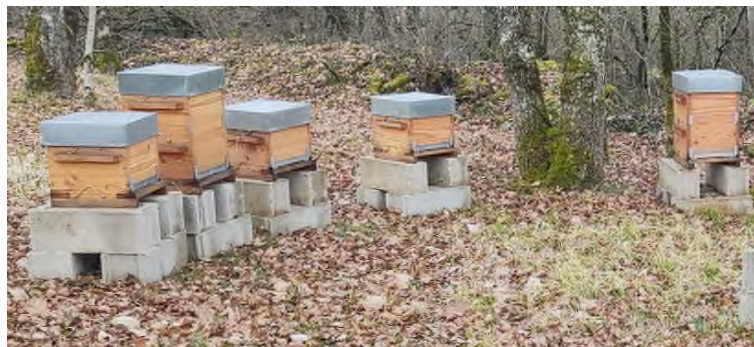
Ruches "Warré" de l'association