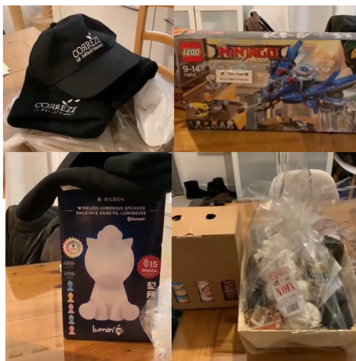
Lots de la tombola