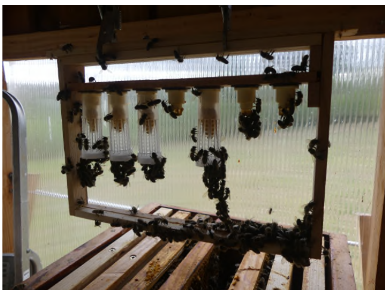
Elevage de reines